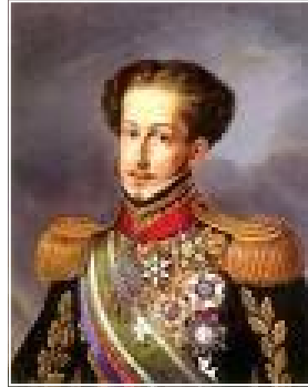
Retrato de D. Pedro I : primeiro imperador do Brasil

História da Independência do Brasil, 7 de setembro, Dom Pedro I, Independência ou Morte, Grito do Ipiranga, Brasil Independente, Brasil Império, Constituição de 1824, José Bonifácio, Dia do Fico.